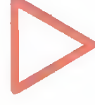
Дорожный знак 2.4