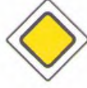
Дорожный знак 2.1